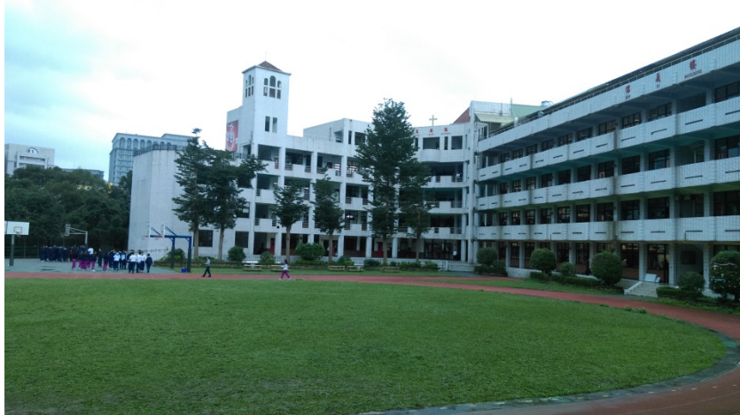
圖(一)飛行競賽場地